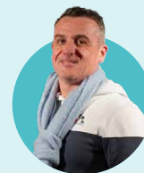
Emmanuel Hemery Agence Transport Agroalimentaire