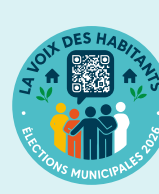
St André Tous ensemble